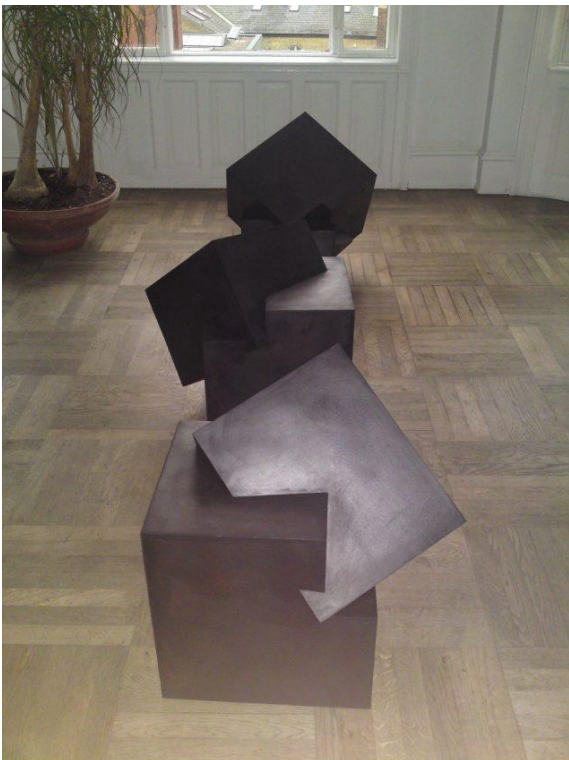
Peter Bonnén: Skulptur kan opstilles på 3 måder , 2009. Tilhører Ny Carlsbergfondet