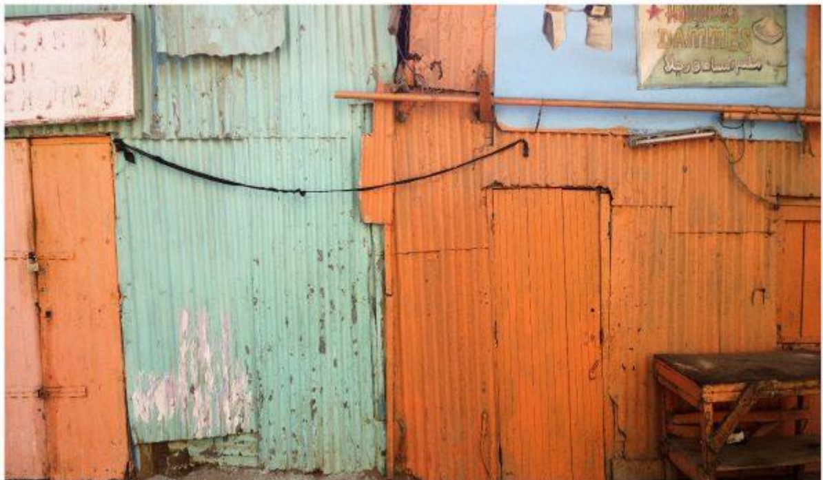
Peter Bonnén: DJIBOUTI 03 , 2015, foto. Udstillet på Davids Samling