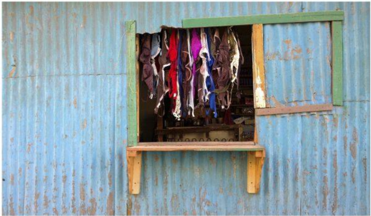
Peter Bonnén: DJIBOUTI 02 , 2015, foto. Udstillet på Davids Samling