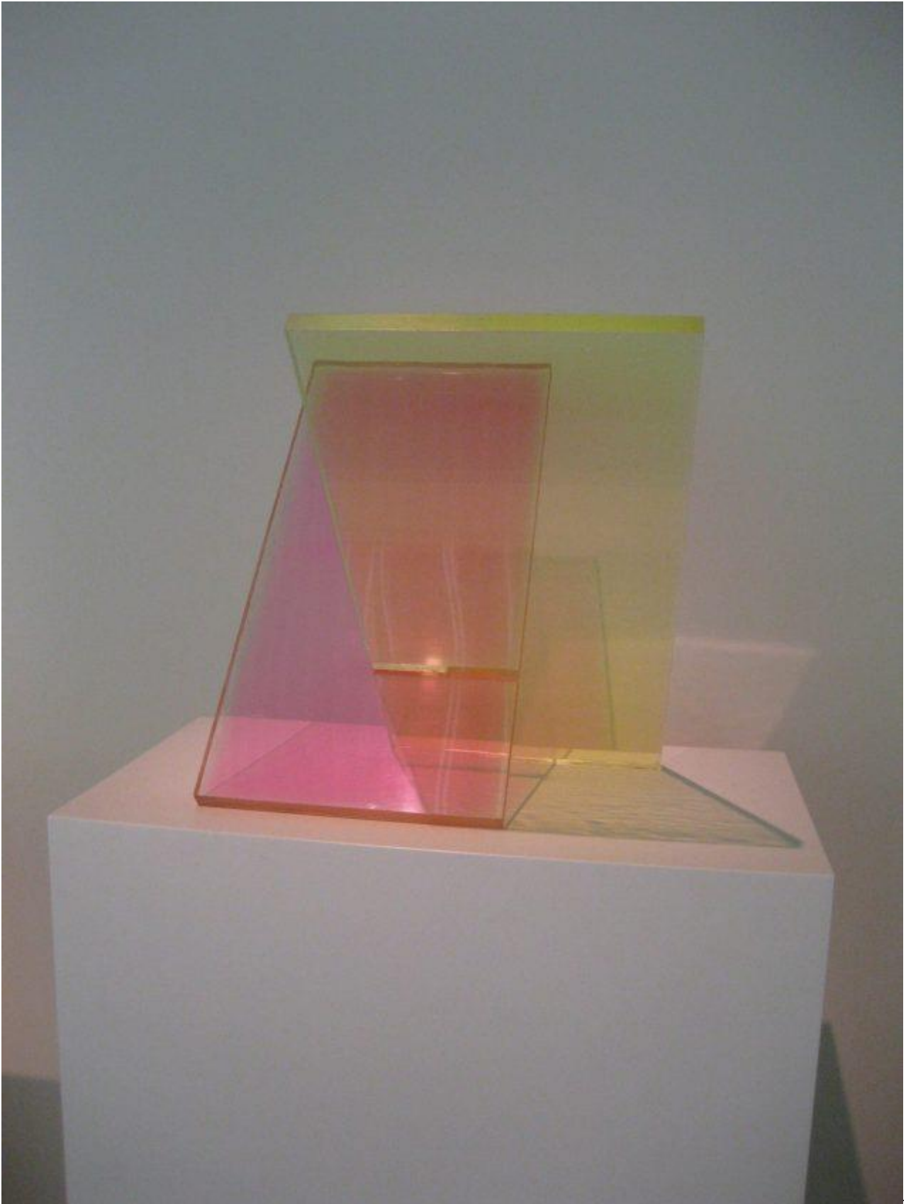
Peter Bonnén: Skulptur i akryl , 1967. ARoS