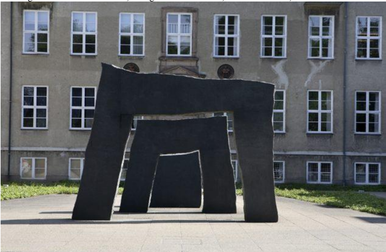
Peter Bonnén: Skulptur i 3 dele , 2000, granit. Foran Rockefeller Center, Juliane Mariesvej, Østerbro

De mest karakteristiske kan beskrives som monumentale, geometriske figurer og flader, der forholder sig til hinanden som størrelser, der oprindeligt var en helhed, men nu er blevet forrykket, forskudt eller splittet. Et andet centralt træk er, at de er rå og stærke. Rå i kraft af deres bulede, sorte og ofte rustne overflader og stærke på grund af deres kompromisløse enkelhed. Med minimalistisk force og selvtillid er det som om, de siger: "Det her er alt, hvad der skal til, kammerat!"