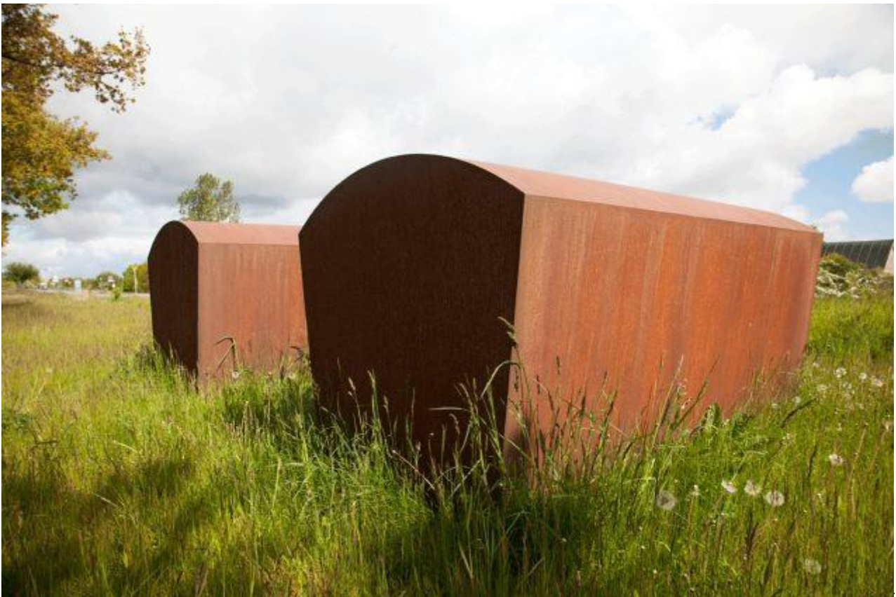
Peter Bonnén: 2 Sarkofager , 1997, stål. Kunstmuseet Arken