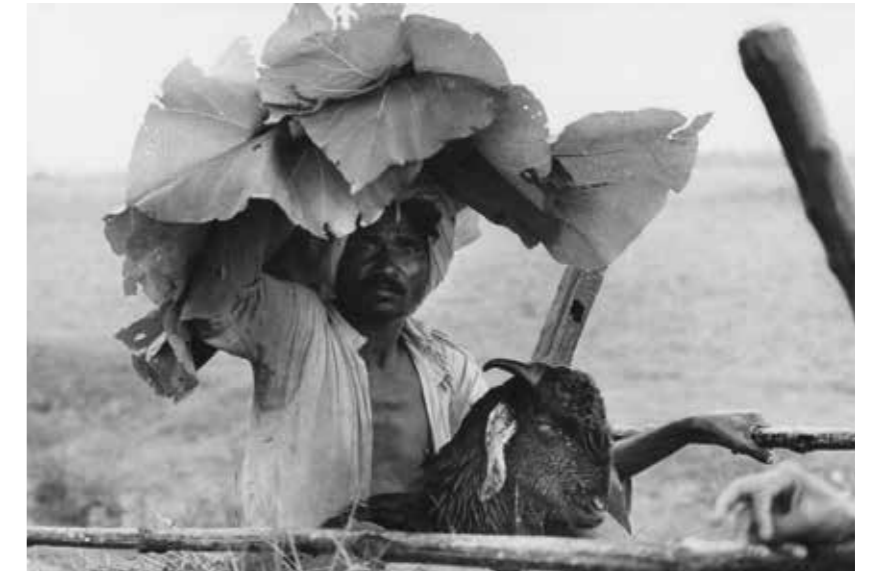
En mand finder skygge under teaktræsblade.

Gardins mest berømte fotografi, In Vaporetto fra Venedig, er et fuldgyldigt eksempel på hans evne til at foretage en nærmest genetisk afkodning gennem fotografiets aftegninger i et både abstrakt og realistisk formsprog. Bogen om hans strejftog i Venedig er en lyrisk, magisk og formelig dekadent beskrivelse af befolkningen i den synkende by, Venise des saisons , udgivet i 1965. Gardin har udgivet flere end 210 fotografiske bøger og er tilknyttet det berømte billedagentur Contrasto i Rom. Hans