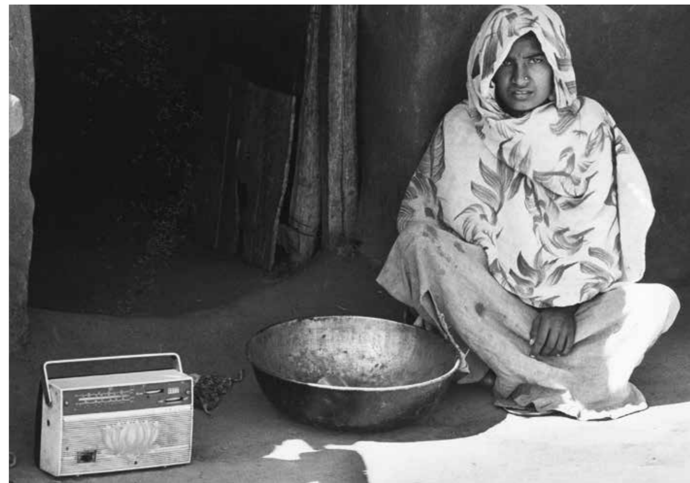
Øverst: Seng ophængt fra loftet i landsbyen Paliya. Foto: Gianni Berengo Gardin. Nederst: Bondekone med radio nær Jhabua. Foto: Gianni Berengo Gardin.