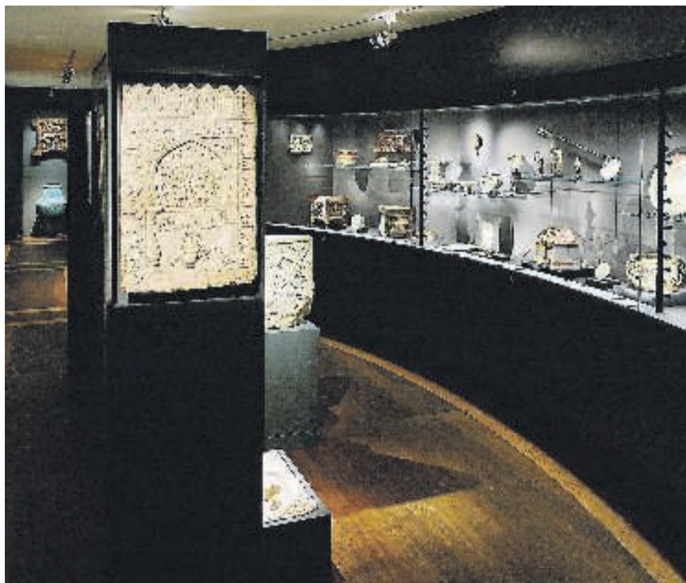
Et besøg på Davids Samling i København er en stor oplevelse.

Kommer man ikke forbi inden udstillingen bliver taget af plakaten 18. maj, kan man læse den fremragende bog, museet har udgivet i forbindelse med udstillingen.