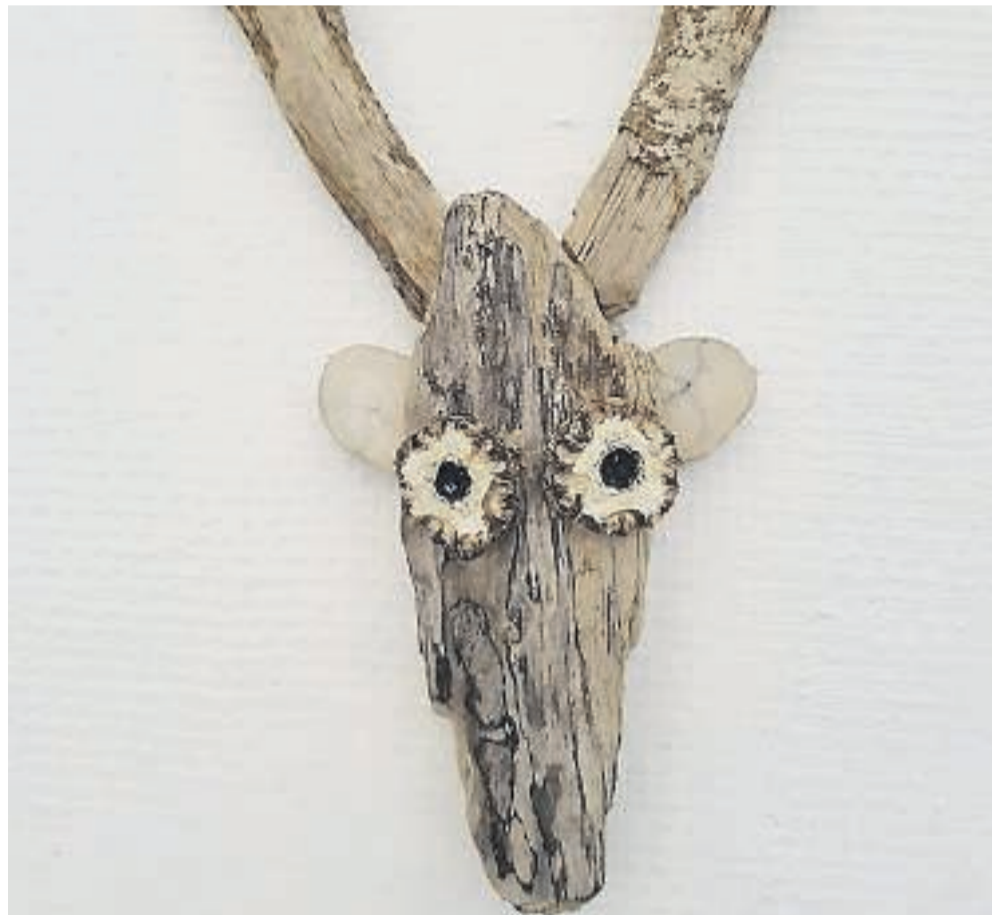
Woodsnitter kommer til Skanderborg. Pressefoto

I sig selv en oplevelse for dem, der måtte være forhindret i at besøge udstillingen.