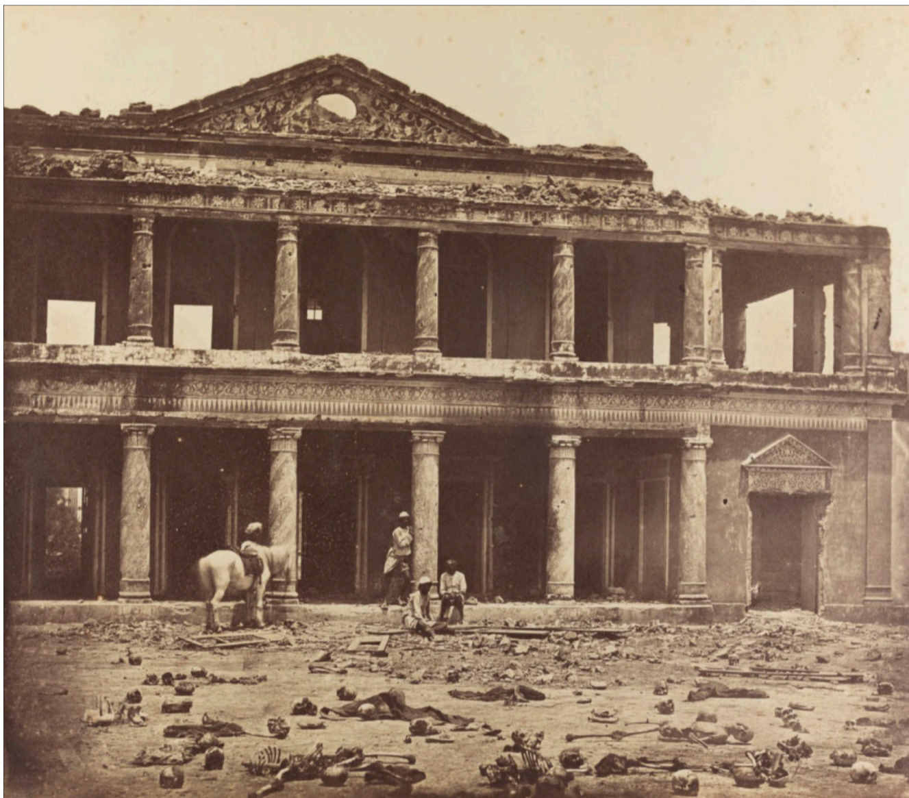
Øjebliksreportage eller rekonstrueret begivenhed? Felice Beato: "Pladsen ved Sikandarbagh i Lucknow", 1858.