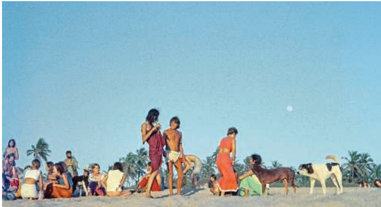
Torben Huss, "Unge vesterlændinge på strand i Goa i 1968, varmer op til en fuldmånefest". Indien.