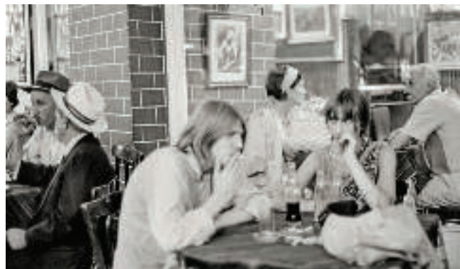
'På café i Istanbul'. Tyrkiet, 1967.

Han rejste uden en særlig tidsplan eller opgaver, der skulle løses. Det handlede om at komme afsted og lade mulighederne vise sig. Torben Huss' siger selv til Davids Samling at: