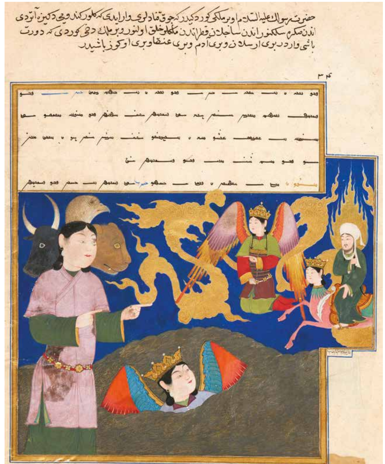
‘Profeten Muhammad møder Englen med 10.000 vinger og Englen med fire hoveder’ Iran, ca. 1465, Davids Samling. Al-Sarai’s Nahj al-faradis (Paradisets vej) beskriver detaljeret Muhammads mystiske himmelfærd: Hans rejse på fabeldyret Buraq til Jerusalem og herfra op i himlene, helt op til Gud, og derpå ned i helvede med dets mange afdelinger.